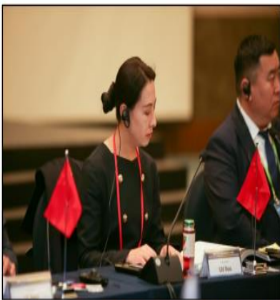
- 실�크로드 심포니, 여의(如意) 간쑤 - <중국 간쑤성 문화관광청 국제처 리우샤오 처장>