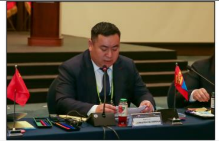
- 볼강아이막의 대외교류현황 - <몽골 볼강아이막 알탕사가에 국장>