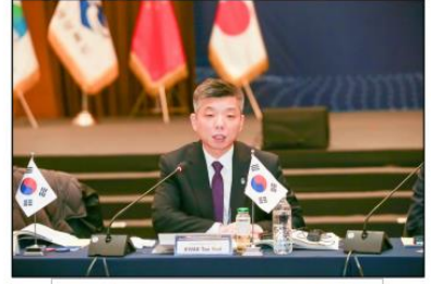
- 근로유학생 제도 소개 - <한국 충청북도 곽태열 국제관계대사>