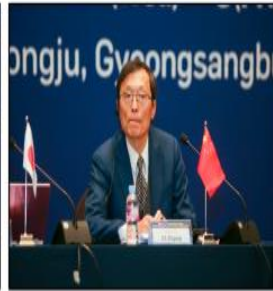
헤이룽장성 동북아연구소 다즈강 연구원