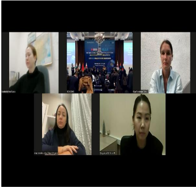
Zoom Meeting 운영 (일본, 몽골, 러시아 온라인 참여)