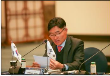
- 경북주도 확실한 지방시대 : K-U시티 프로젝트 지방 정주시대 대전환 - <한국 경상북도 채진원 국제관계대사>