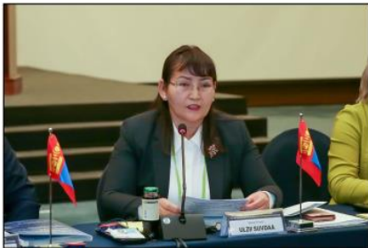
- 셀렝그아이막의 협력가능 분야 - <몽골 셀렝그아이막 울찌 소브따 국장>