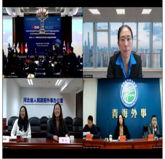
Tencent Meeting 운영 (중국 온라인 참여)