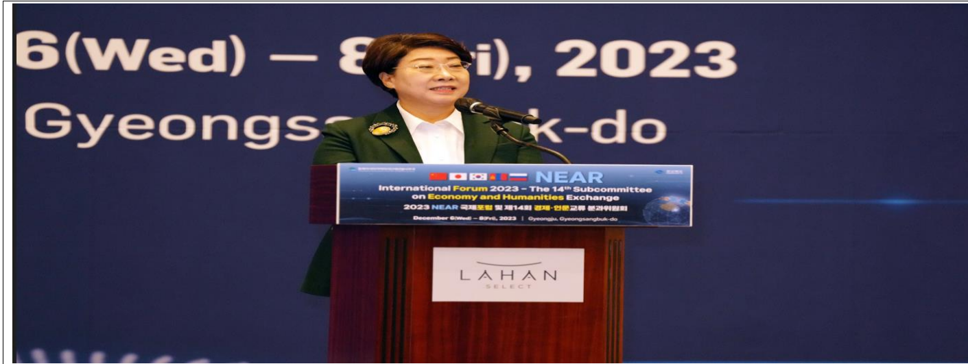
Заместитель Губернатора провинции Северная Кёнсан Ли Даль Хи