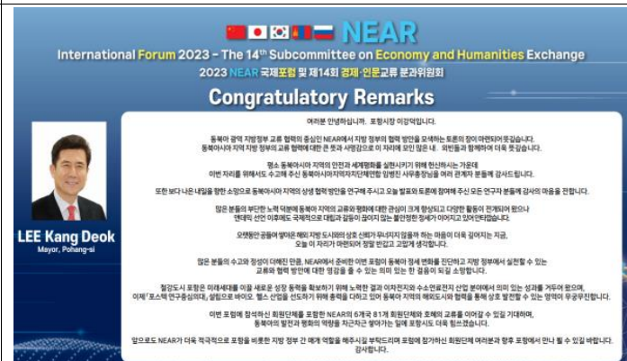
Поздравительные речи гостей